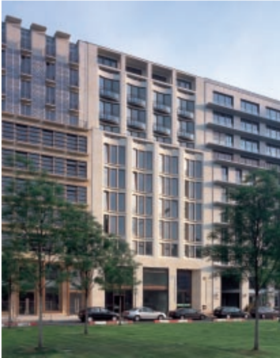
4. Ansicht des Gebäudes vom Leipziger Platz.