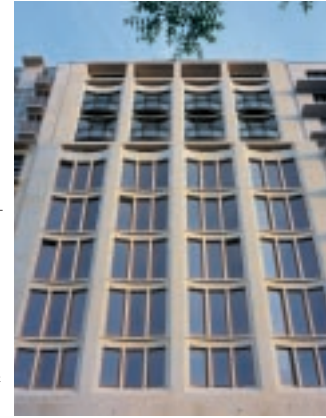
5. Fassadenausschnitt.

Zur deutlichen Unterscheidung haben die Wohnetagen zwar dieselbe steinerne, konkave Fassadenstruktur wie