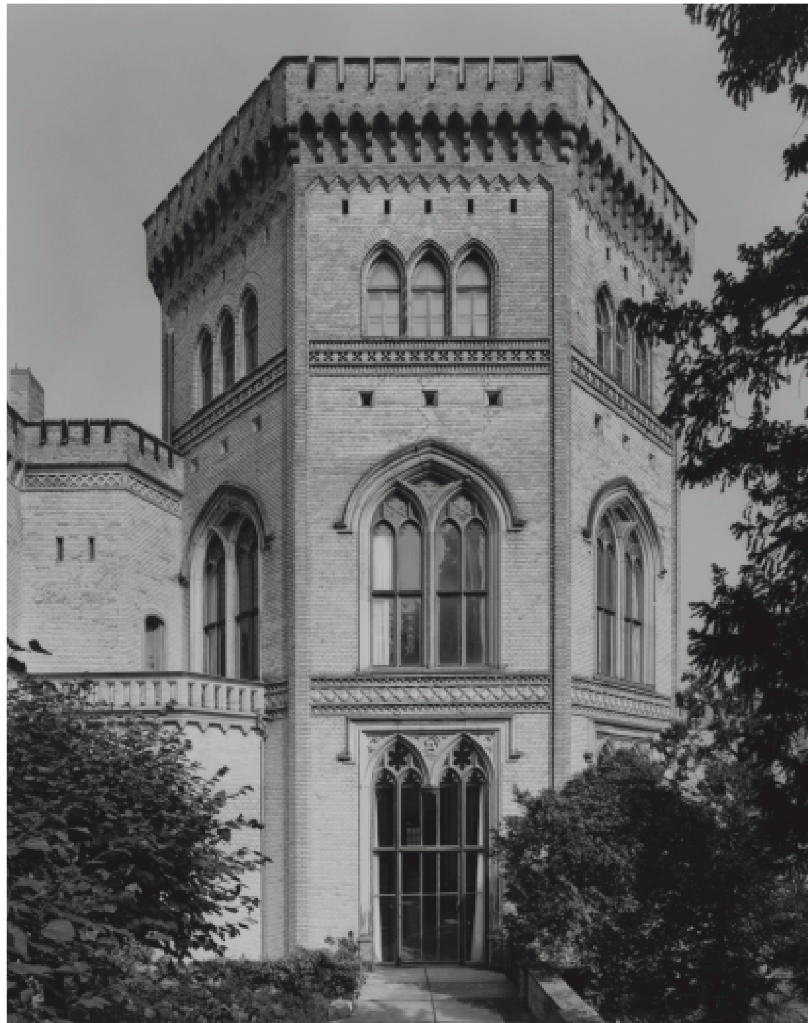
51. Potsdam, Park Babelsberg, Schloss, 1844–49. Ansicht des Oktogons von Südosten. 23. Aug. 2002.