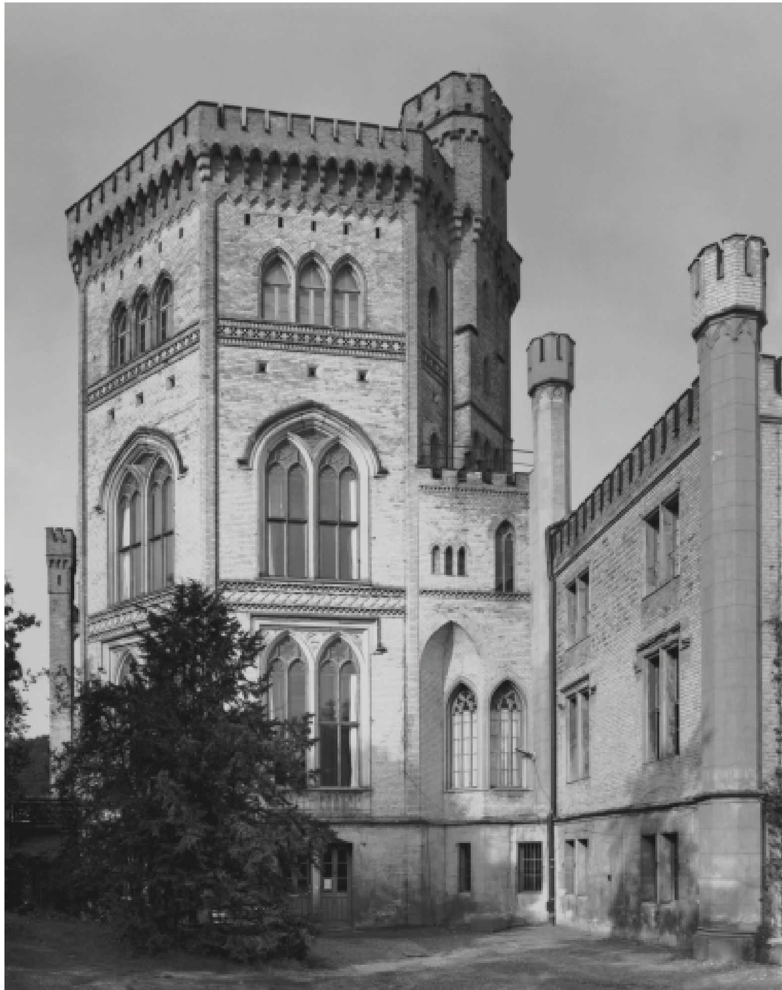
49. Potsdam, Park Babelsberg, Schloss, 1844–49. Ansicht des Oktogons von Nordosten. 23. Aug. 2002.