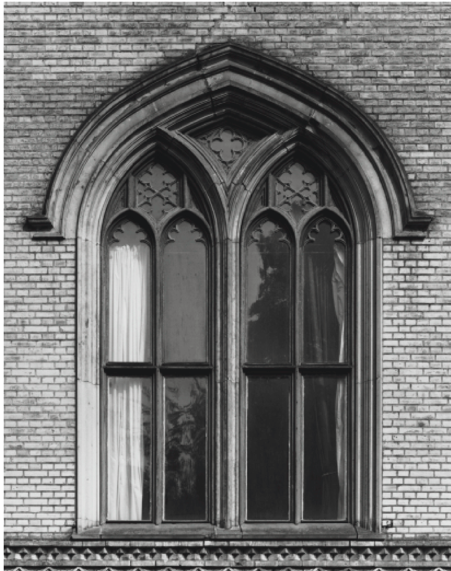
53. Potsdam, Park Babelsberg, Schloss, 1844–49. Südostfenster des Tanzsaals. 23. Aug. 2002.