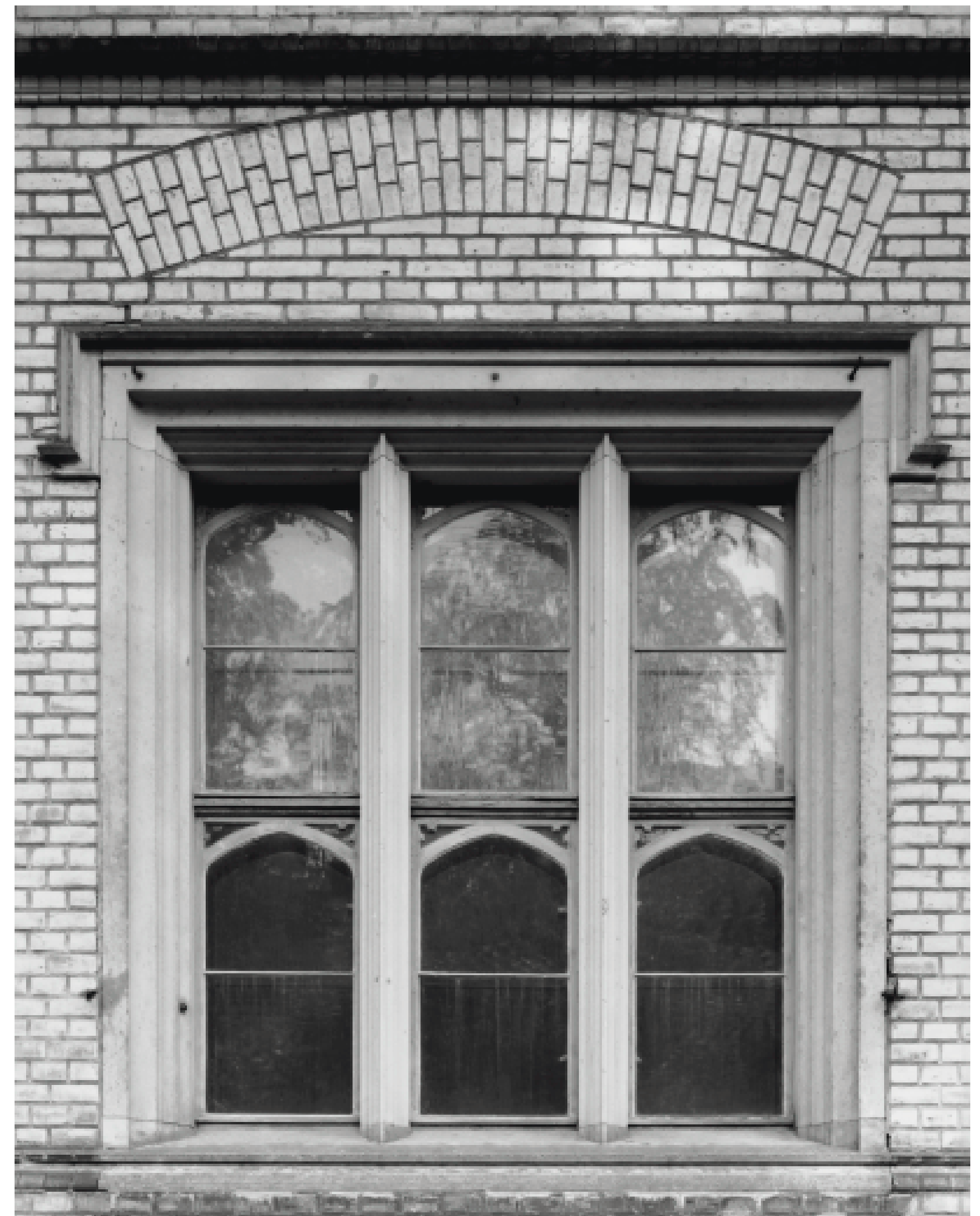
54. Potsdam, Park Babelsberg, Schloss, 1844–49. Window in the central part looking south-east. 23 Aug. 2003.