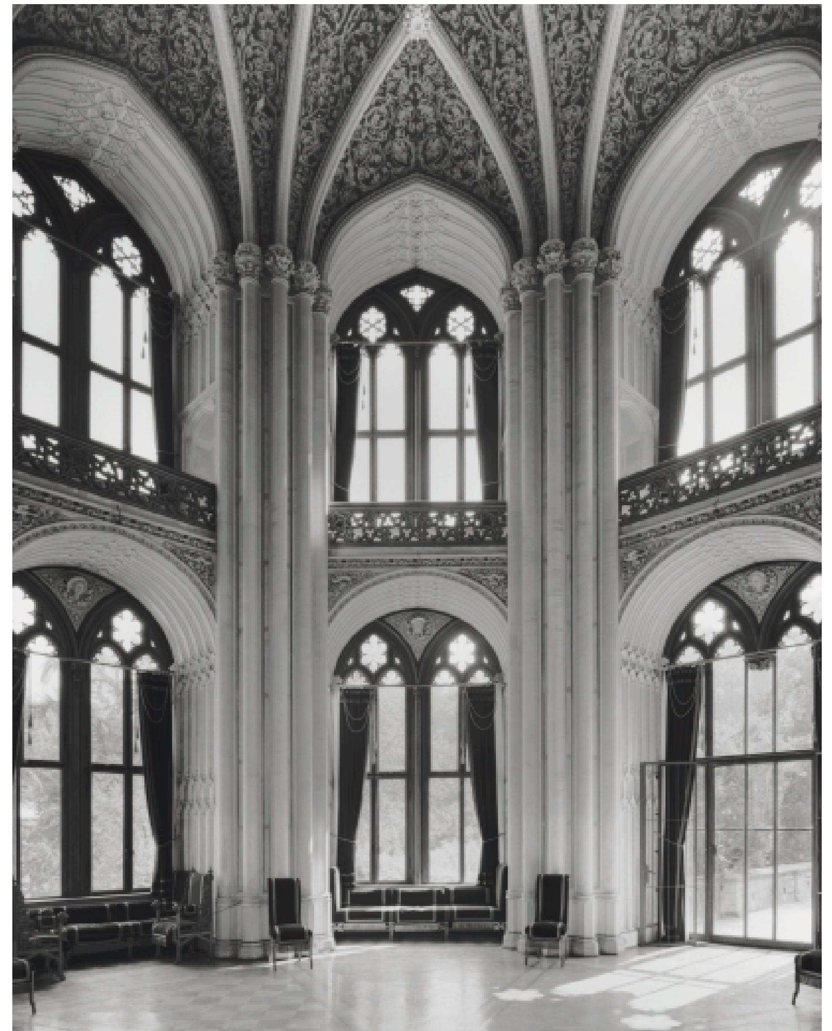
56. Potsdam, Park Babelsberg, Schloss, 1845–49. Interior view of the ballroom. 23 Aug. 2002.