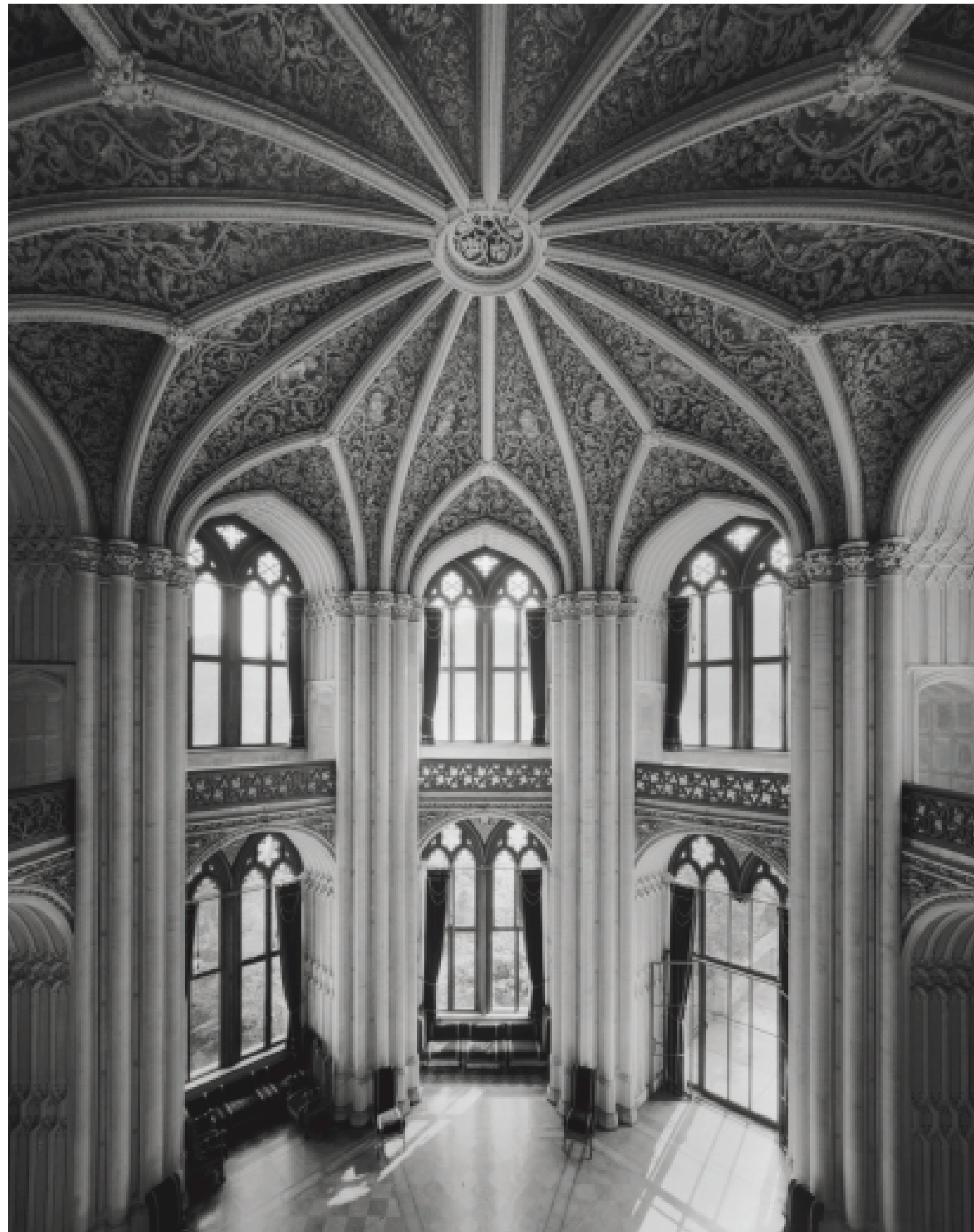
55. Potsdam, Park Babelsberg, Schloss, 1845–49. Innenansicht des Tanzsaals von der Galerie aus. 23. Aug. 2002.