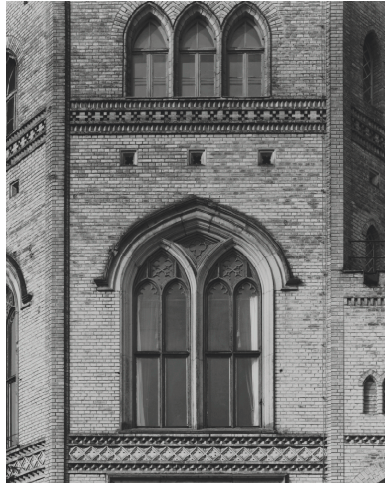
50. Potsdam, Park Babelsberg, Schloss, 1844–49. Detailed view of the octagon from the north-east. 23 Aug. 2002.