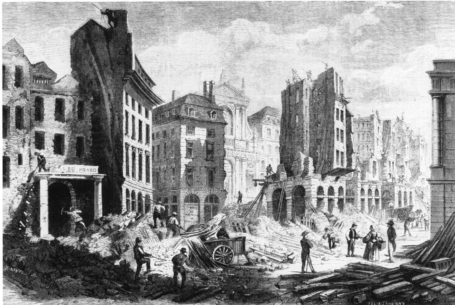
157. Durchbruch des Boulevard du Palais mit den Zerstörungen in der Rue de la Barillerie, Paris. Stich von H. Linton. (Musée Carnavalet, Paris)

Ein Dekret vom 21. Juni 1854 brachte den Bau der Markthallen nach dem neuen Plan wieder in Gang. Straßen und Hallen erhielten einen größeren Zuschnitt. An Stelle von 8 sollten nun 14 Pavillons entstehen. Und statt 147 mußten jetzt noch zusätzlich 180 Ge-