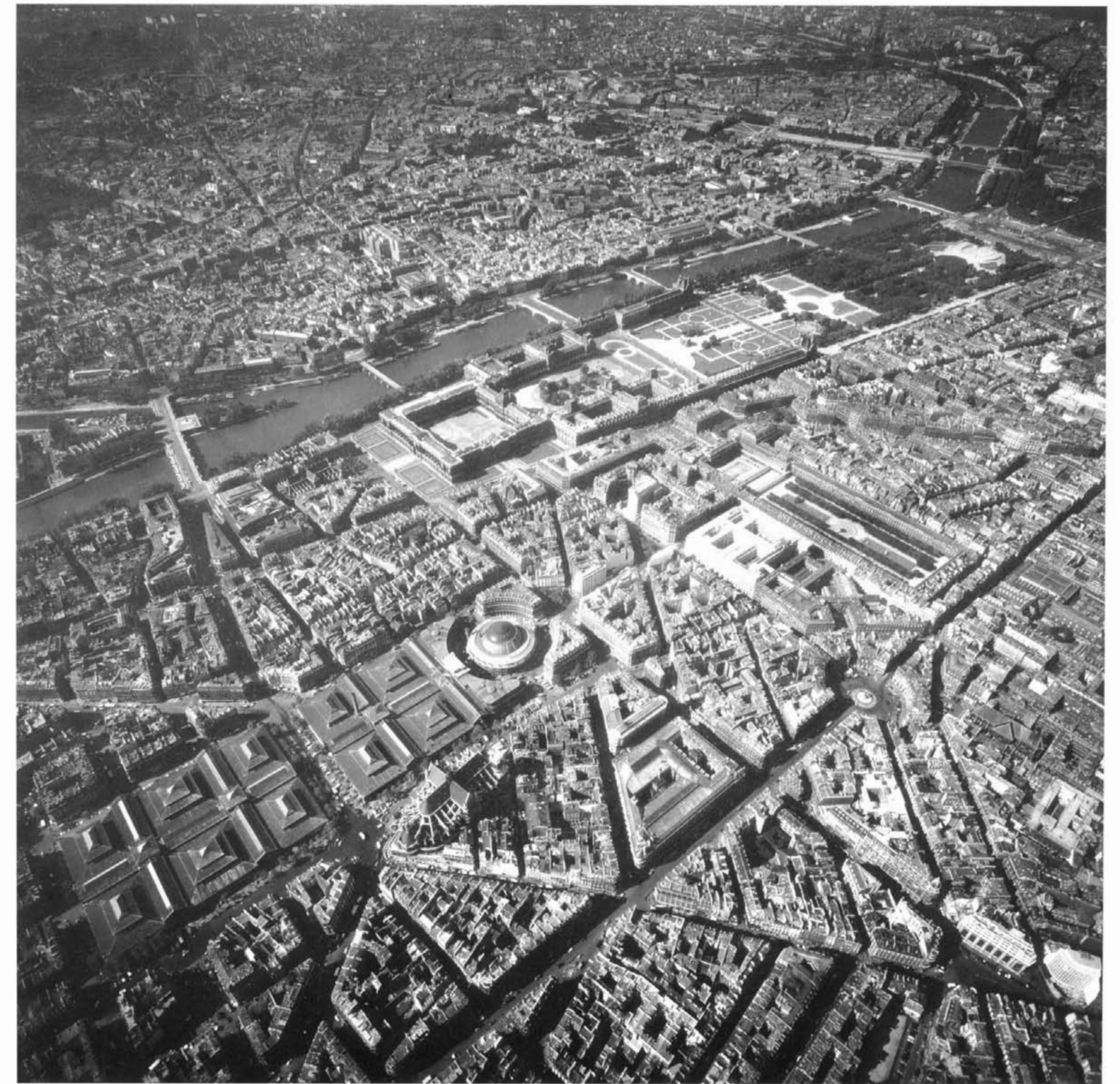
158. Paris aus der Luft mit den Halles centrales, dem Louvre und dem Palais Royal.

bäude den Neubauten weichen. Es zeigte sich auch hier, in welche Dimensionen Haussmann die Aufgabe zu rücken wußte. Als nördlicher Abschluß umgrenzte die ausgeweitete Rue Rambuteau den Bezirk. Die Rue du Pont-Neuf stellte die Verbindung mit der Rue de Rivoli und dem Seine-Quai her; die Rue des Halles eröffnete den Weg zur Place du Châtelet. Während die Bemühungen Rambuteaus und Bergers zwischen 1844 und 1855 lediglich eine Steinhalle hervorgebracht hatten, die so unzeitgemäß war, daß sie wieder abgetragen werden mußte, gelang es Haussmann scheinbar mühelos, zwischen 1854 und 1857 sechs große Pavillons errichten zu lassen. Sie waren zum größten Teil in Eisen und Glas konstruiert; ihre Durchfahrtdächer, ihre Belichtung und Luftzirkulation galten als vorbildlich. 29 Die von 15 auf 44 Millionen Francs gestiegenen Baukosten wußte Haussmann auf seine Art zu begründen: Nicht die Höhe der Ausgaben, sondern nur der tatsächliche Nutzen und die weitsichtige Anlage würden später einmal über den Wert seines Werkes bestimmen. Am nötigen Selbstvertrauen fehlte es dem Präfekten nicht, al-