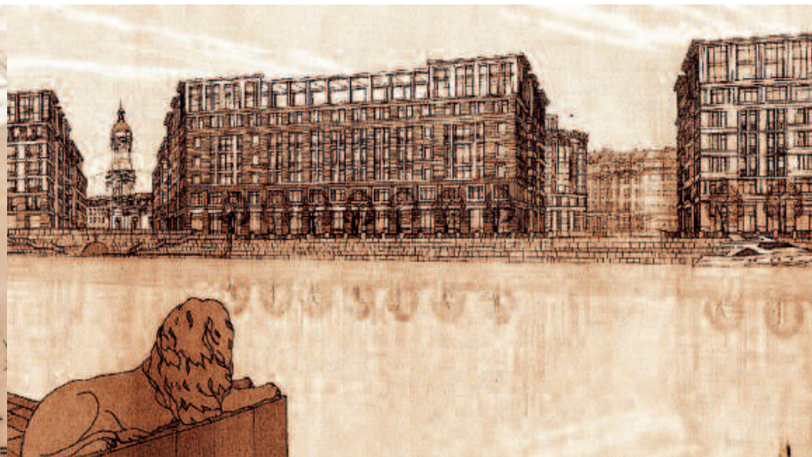
Master plan for the European Embankment: E. Gerasimov, S. Tchoban