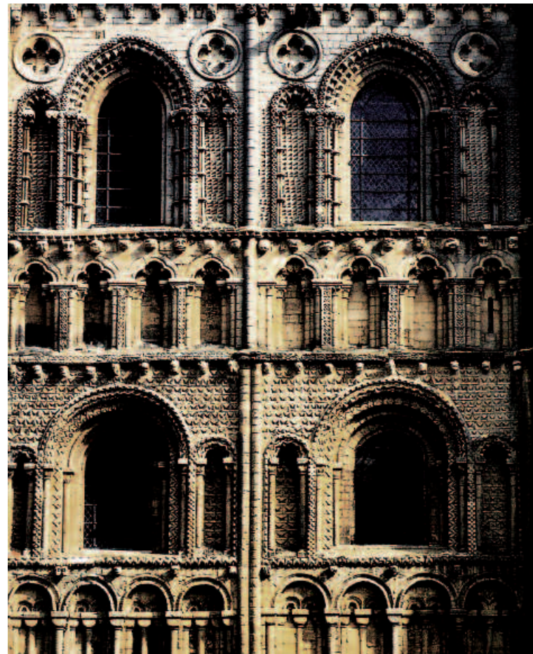
Detail of the western façade, Ely Cathedral, Cambridgeshire, 11th-12th century

Скульптура, являясь считываемым искусством, может благодаря своему суггестивному действию на реципиента вновь перенять традиционную роль, которую она играла во все времена: роль формирующего идентичность элемента, рассказчика, путевого указателя, стража, нравственного ориентира... Мои фигуры не шуты или шарлатаны, они – одновременно дыхание и душа жильцов.