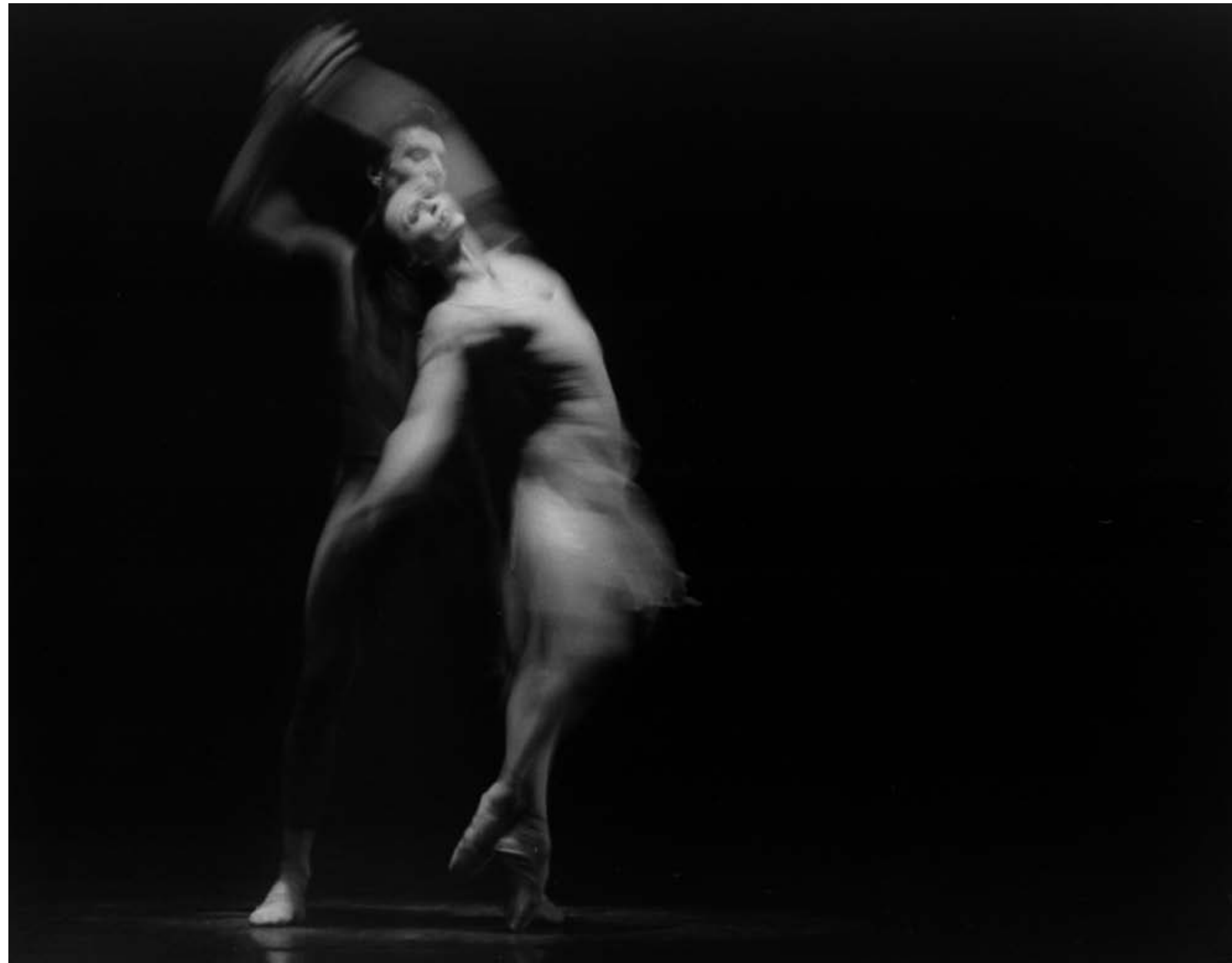
39. Birgit Keil and Vladimir Klos, dress rehearsal for the ballet Elegie für eine tote Liebe by Norbert Vesak, Stuttgarter Ballett, Württembergisches Staatstheater Stuttgart, 15 July 1985. 40. Dress rehearsal for the ballet Canto Vital by Azari Plisetski, Stuttgarter Ballett, Württembergisches Staatstheater Stuttgart, 31 March 1986.