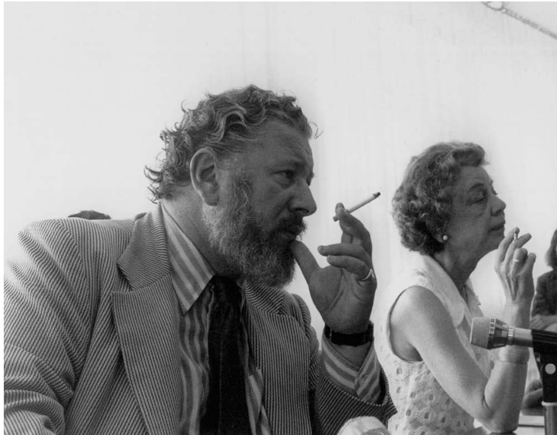
11. Peter Ustinov at the 22nd Berlin International Film Festival, 2 July 1972. 12. Claudia Cardinale and Marco Ferreri at the 22nd Berlin International Film Festival, 2 July 1972.