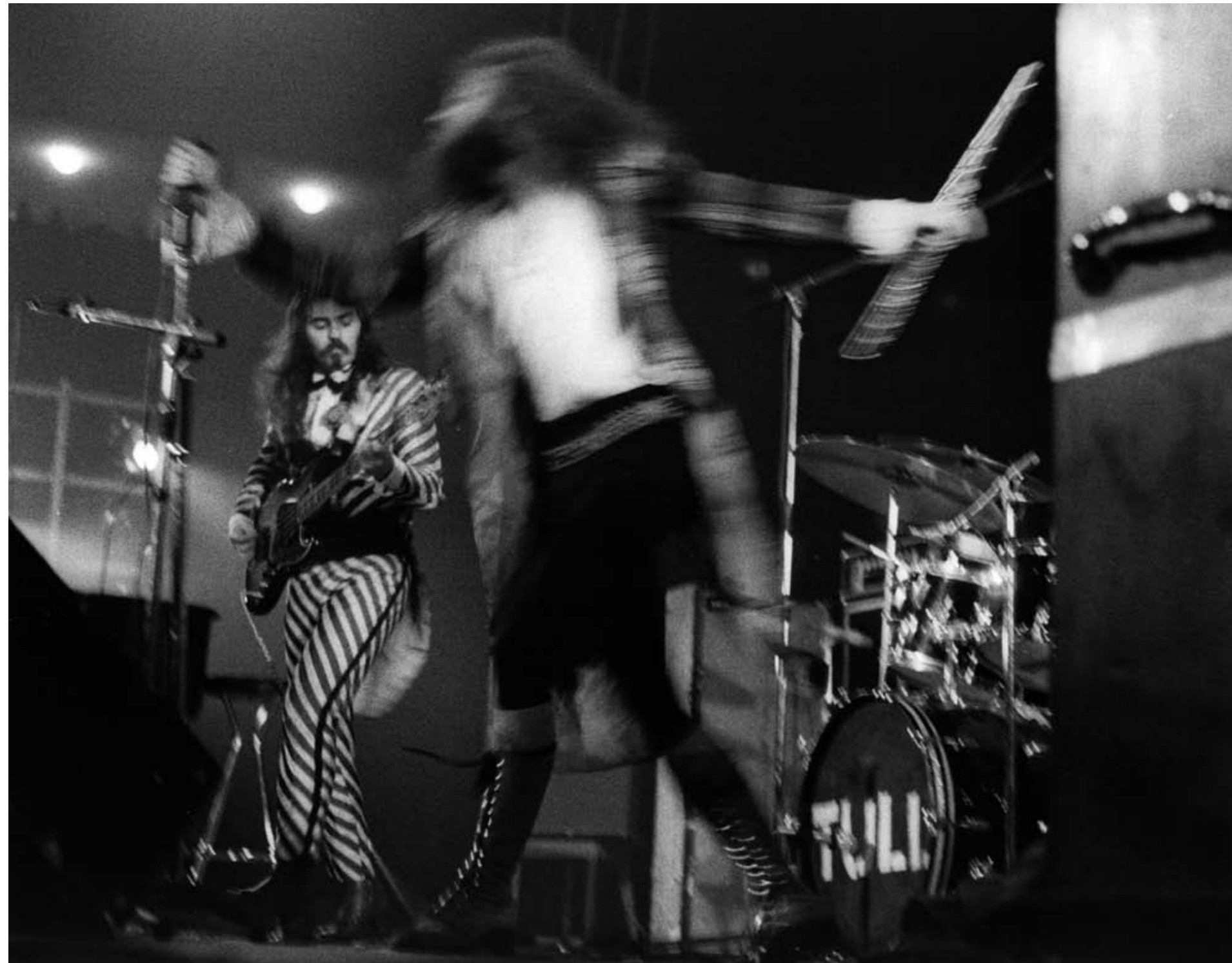
7. Jethro Tull, Deutschlandhalle, Berlin, 18 January 1972. 8. Klaus Kinski as »Jesus Christ Redeemer«, Deutsch- landhalle, Berlin, 19 November 1971.