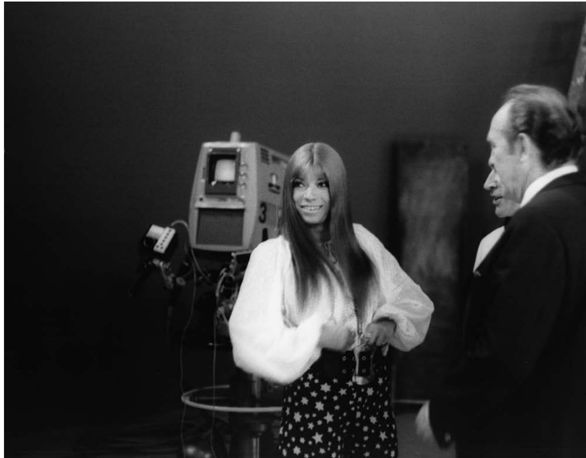
9. Katja Ebstein, Berlin, 27 April 1971. 10. Pier Paolo Pasolini on the occasion of the awards ceremony at the 22nd Berlin International Film Festival, 4 July 1972.