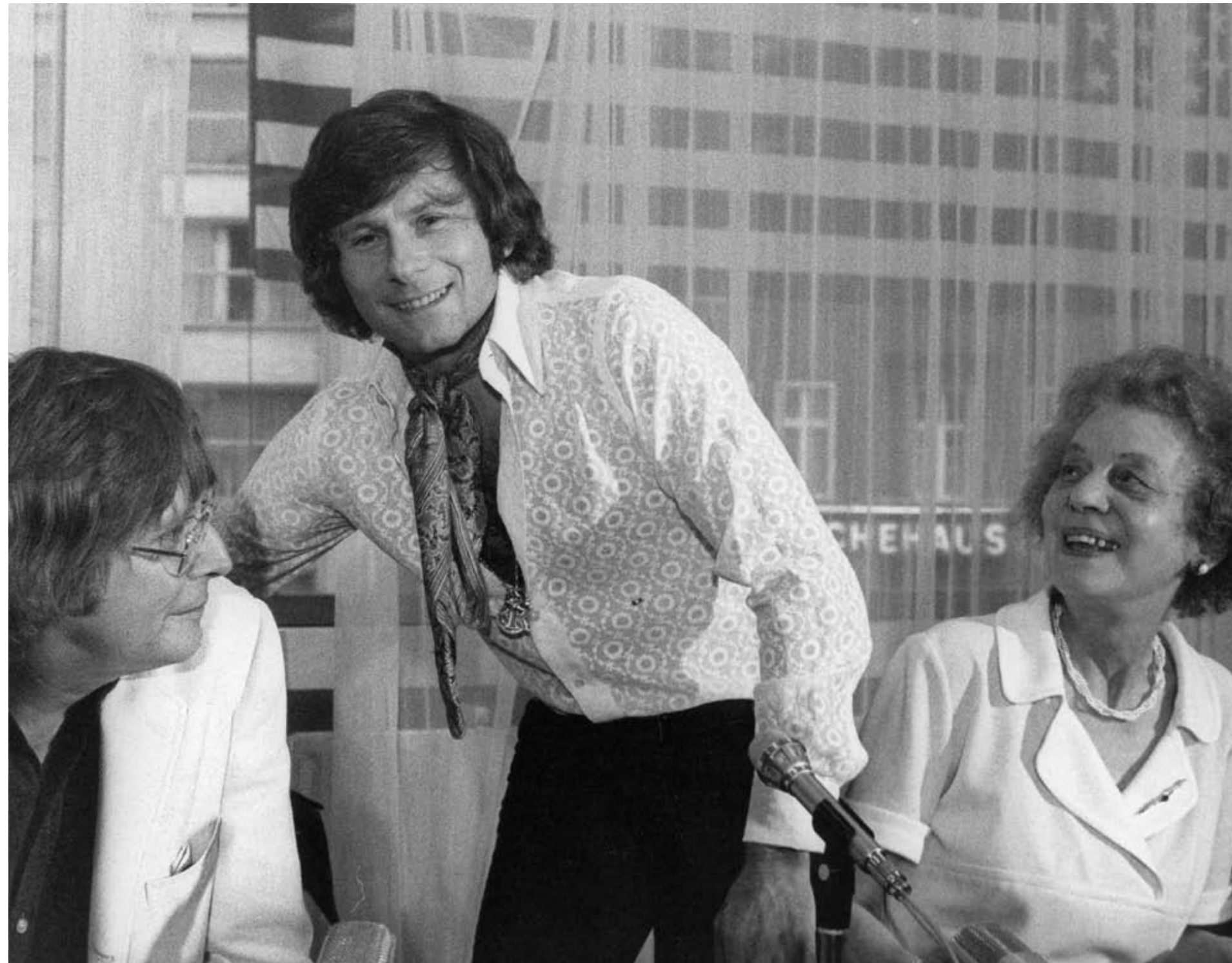
13. Roman Polanski at the 22nd Berlin International Film Festival, 28 June 1972. 14. Hugh Griffith and Josephine Chaplin at the 22nd Berlin International Film Festival, 3 July 1972.