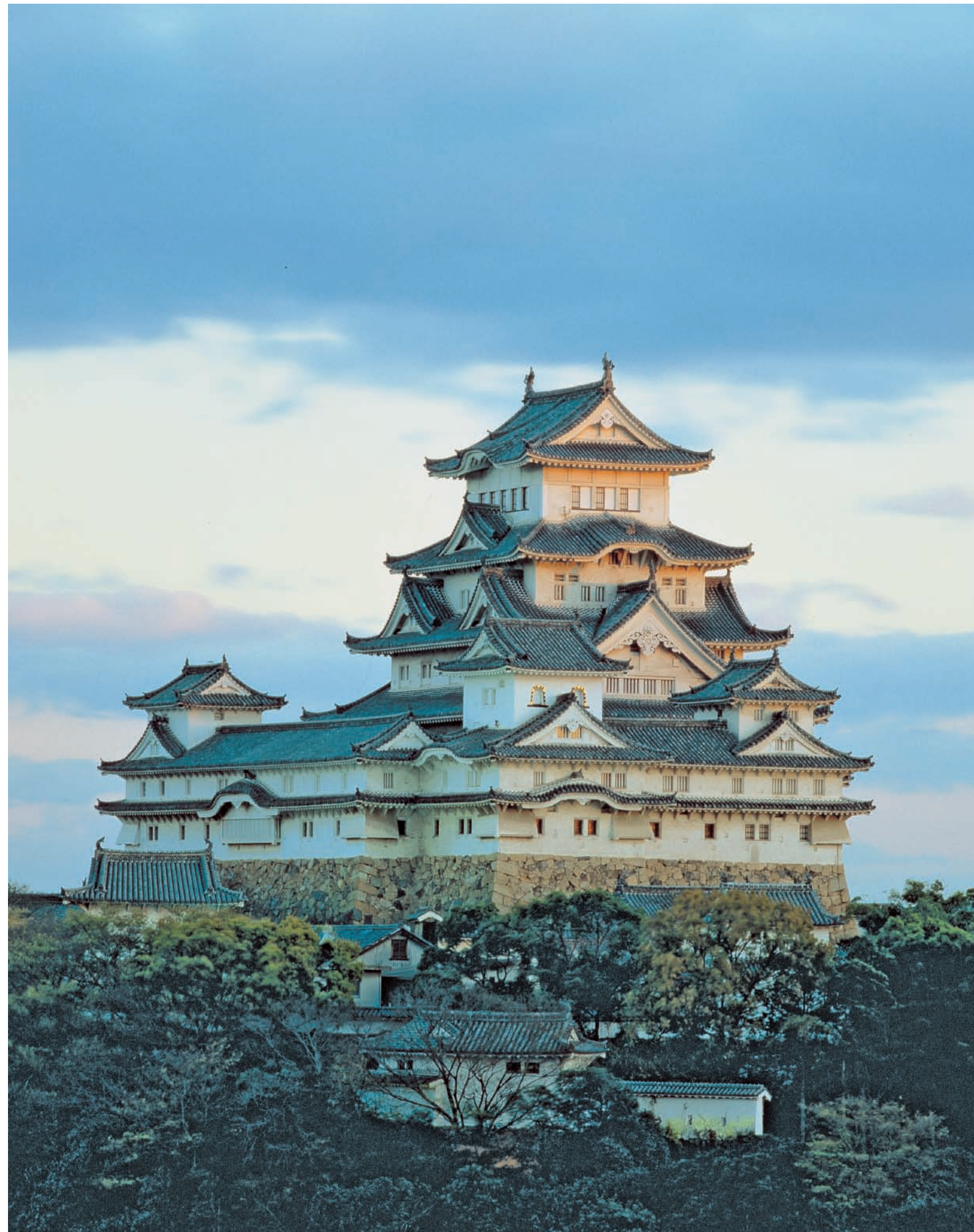
1. Blick vom Otoko-yama auf den Dai-tenshu-kaku. 2. Blick von Südosten auf den Dai-tenshu-kaku.