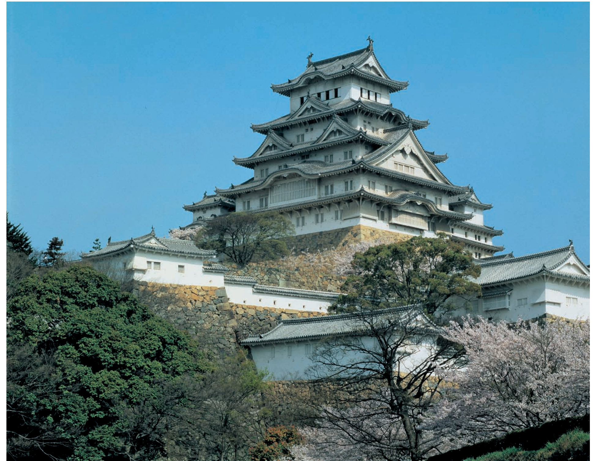
1. View of the Dai-tenshu-kaku from the Otoko-yama. 2. View of the Dai-tenshu-kaku from the southeast.