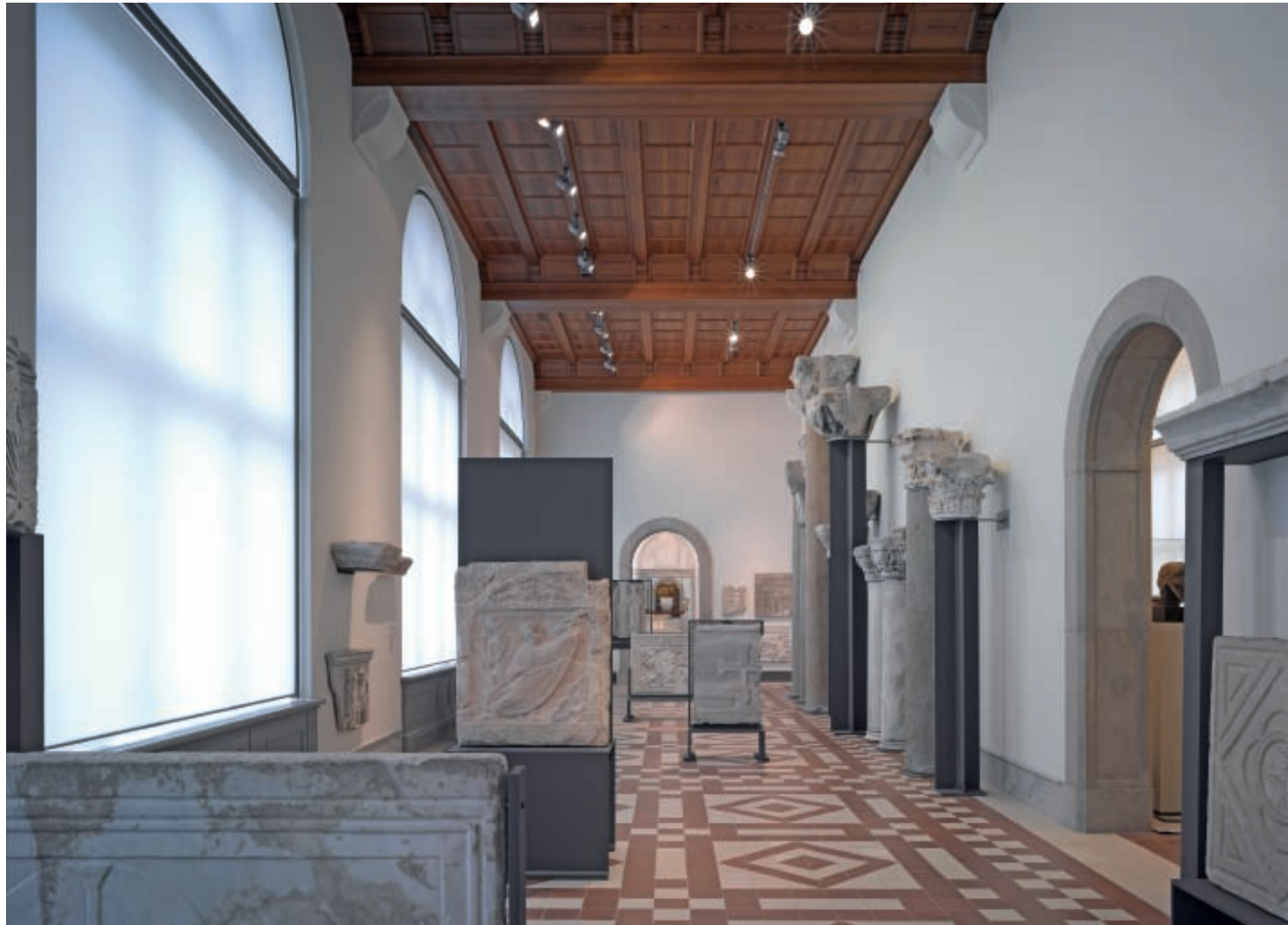
22, 23. The room for Byzantine art on level 1 in the western part of the wing on the Spree River.