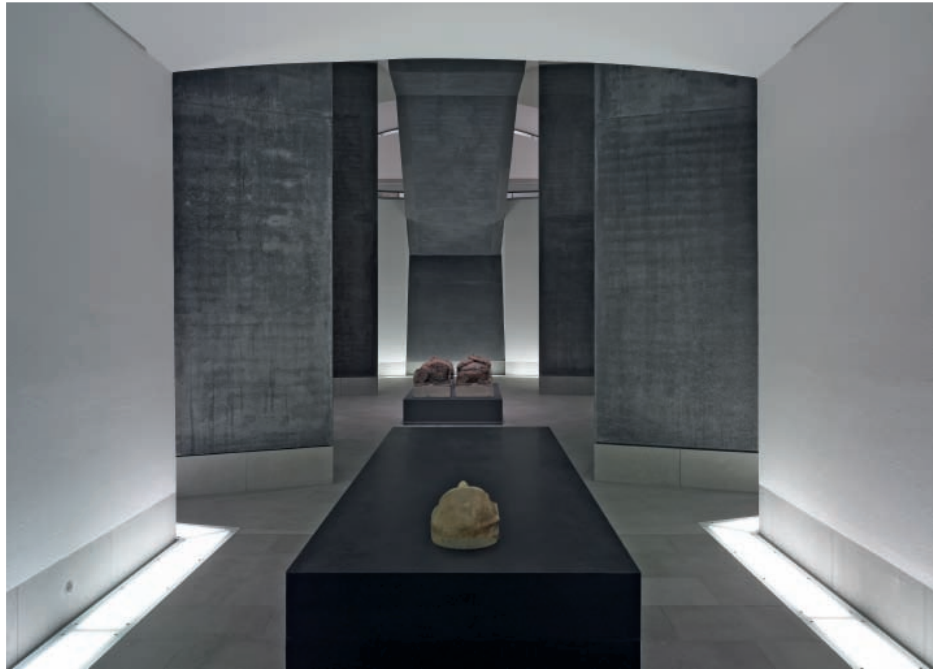
10, 11. Detailed views of the newly created space under domed rotunda on the south-east side.