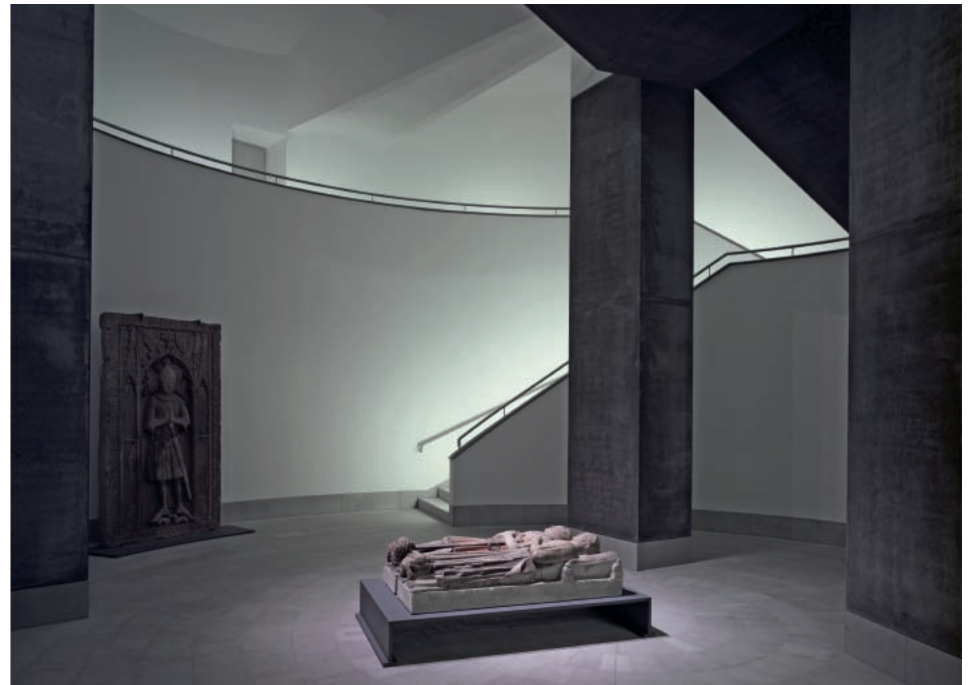
12, 13. Detailed views of the newly created space under domed rotunda on the south-east side.