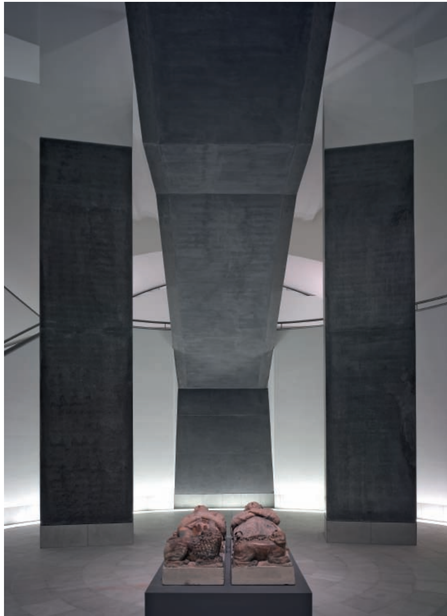
12, 13. Detailansichten des neu geschaffenen Raumes unter der Kuppelrotunde auf der Südostseite.