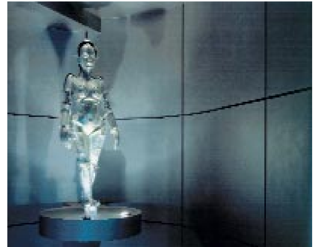
6. Die Maschinen-Maria aus Metropolis von Fritz Lang.