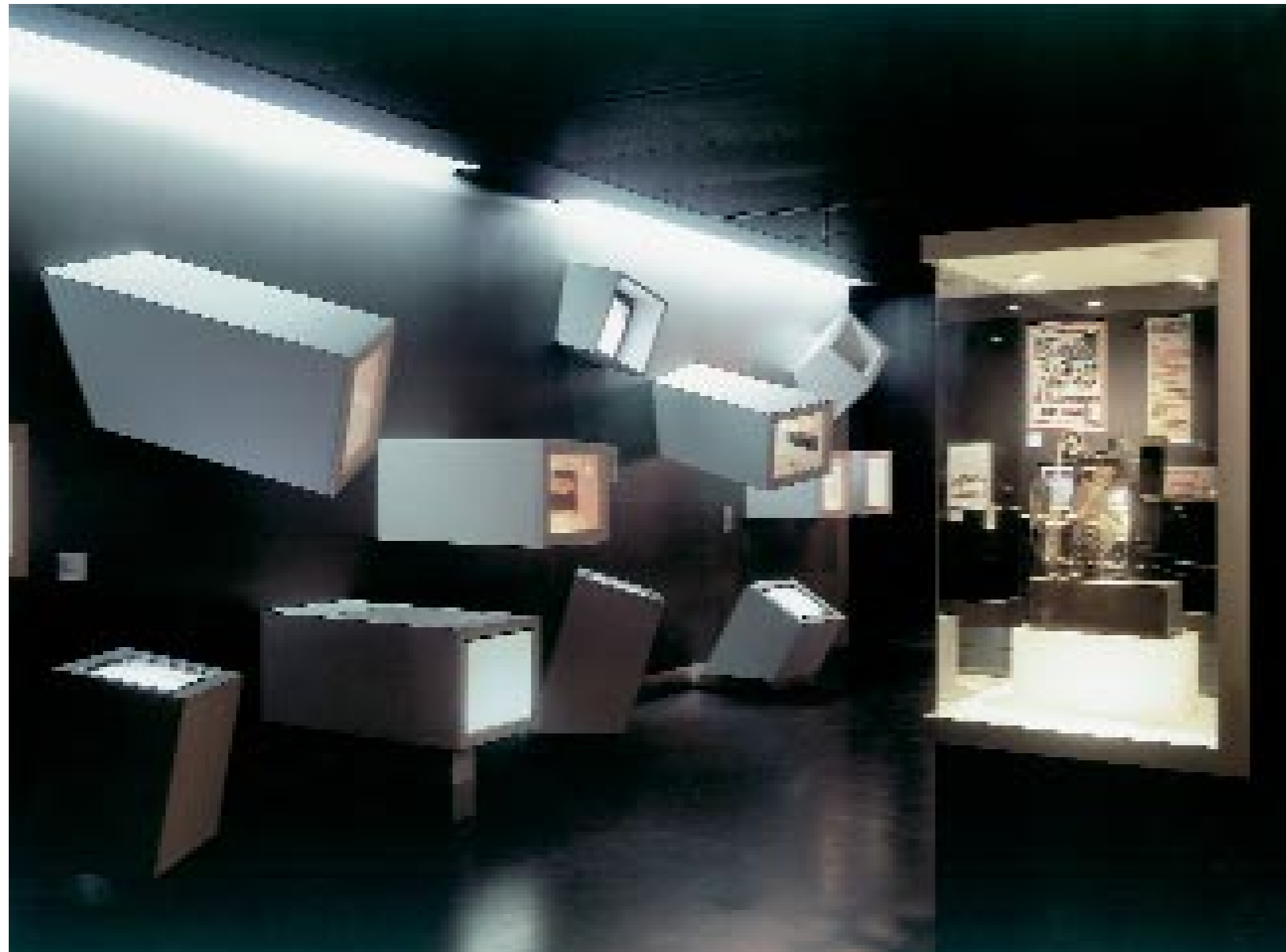
4. Blick in den Frühzeit-Raum des Films. 5. Die 1920er Jahre.